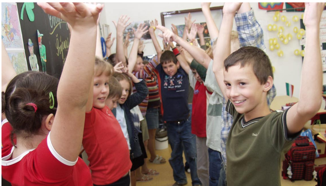
Podporovány budou rovněž preventivní aktivity sociálně patologických jevů na školách. Ilustrační foto.