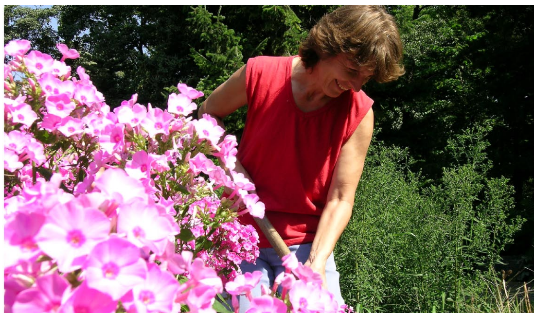
V rámci projektů je zvláštní důraz věnován také revitalizaci městských parků.