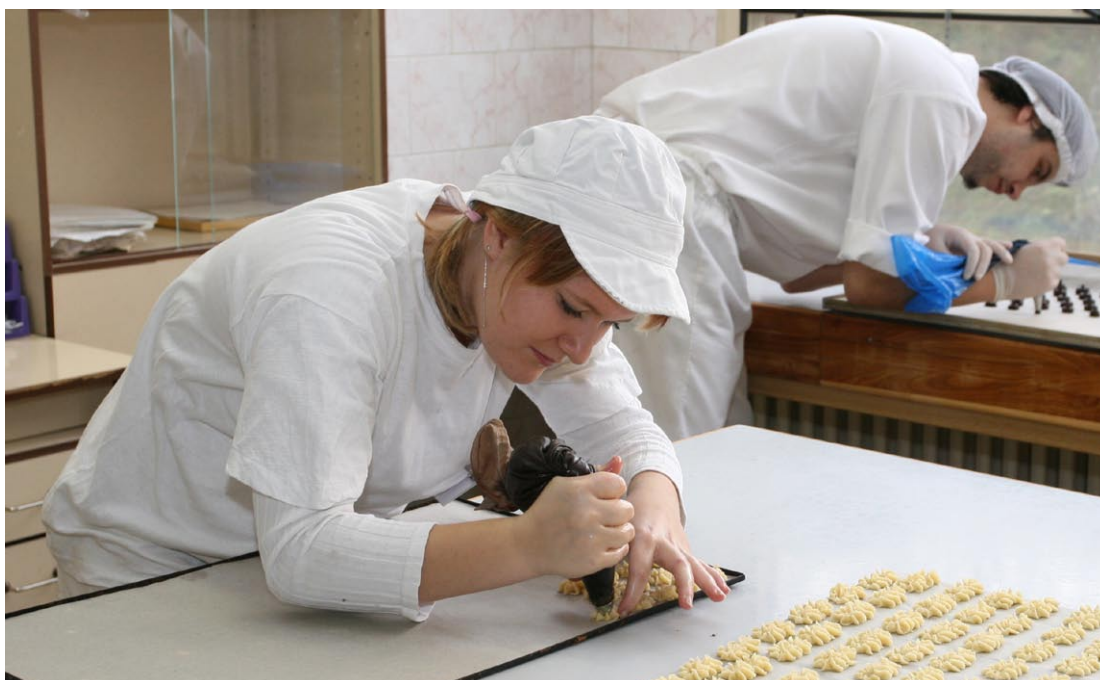
Společné projekty s polskými partnery se mimo jiné týkají oblasti gastronomie.