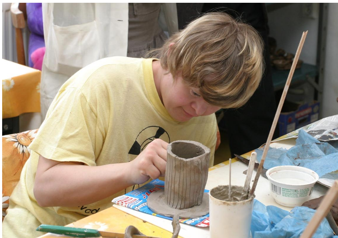
Kvalifikovaní pracovníci v sociálních službách mohou klientům nabídnout tu nejlepší péči.

Nástroj strategického managementu, se kterým poprvé pracovala na počátku 80. let minulého století firma Xerox. Smyslem je poznat vlastní postavení na trhu a následně tuto pozici zlepšit na základě srovnání s konkurencí. Důraz je kladen na zlepšení vlastních nedostatků, využití vlastních předností a učení se z pozitivních kroků konkurence.