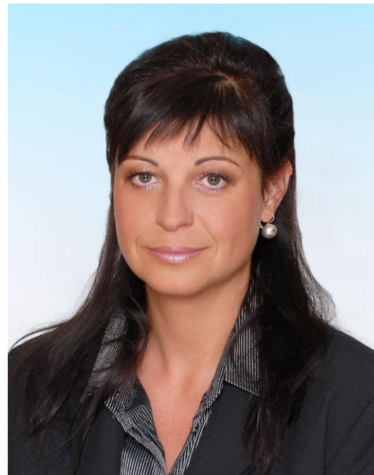
Yvona Kubjátová – náměstkyně hejtmanky Olomouckého kraje.

Při sestavování priorit se dále osvědčila spolupráce s lokalitami Olomouckého kraje, které na svém území realizují proces komunitního plánování sociálních služeb a mají zpracován svůj vlastní komunitní plán a také spolupráce s veřejností, která měla možnost připomínkovat navrhované priority Střednědobého plánu. (ku)