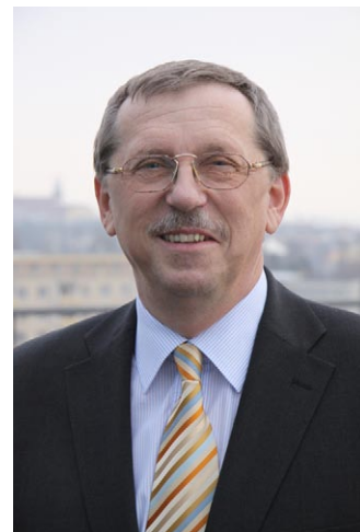
Ing. Martin Tesařík hejtman Olomouckého kraje

Vážení občané, programovací období Evropské unie pro roky 2007 až 2013 je ve své polovině, proto mi dovoluji krátké zhodnocení dosavadního čerpání prostředků z Regionálního operačního programu Střední Morava. Regionální rada rozděluje podporu pro Olomoucký a Zlínský kraj dosud schválila 440 projektů v celkovém objemu 7,5 miliardy korun. Projekty předpokládají vznik více než tři set nových pracovních míst, což je v době ekonomické recese velmi dobrou zprávou. Půl miliardy korun jsme uvolnili pro cestovní ruch, další jeden a půl miliardy na rozvoj měst a venkova. Tyto prostředky určené konkrétním investičním projektům již mění podobu našeho regionu a pomáhají jeho rozvoji. Pro nadcházející období jsme připravili další výzvy k podávání projektů, tentokrát v oblasti dobrovolných aktivit, sociálních služeb, vzdělávání a cestovního ruchu. Věřím, že projekty z našeho kraje budou opět úspěšné.