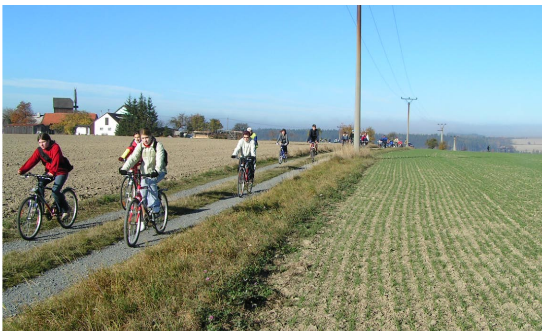
Cyklistika je v regionu vyhledávanou volnočasovou aktivitou.

V současnosti probíhá schvalování tohoto důležitého materiálu v příslušných krajských orgánech. Zpracovatel ÚS také současně připravuje Oznámení koncepce podle zákona č. 100/2001 Sb., o posuzování vlivu na životní prostředí, ve znění pozdějších předpisů, které následně poputuje na Ministerstvo životního prostředí. Olomoucký kraj se problematikou bezmotorové dopravy zabývá již dlouhodobě a výstavba stezek a tras pro cyklisty je podporována z rozpočtu Olomouckého kraje prostřednictvím finančních příspěvků na výstavbu a opravu cyklostezek. (sr)