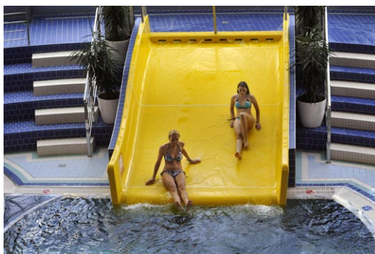
O peníze na rozvoj volnočasových aktivit je velký zájem.

V pořadí šestnáctá výzva z Regionálního operačního programu Střední Morava byla vyhlášena v pondělí 9. listopadu 2009. V rámci této výzvy budou podporovány projekty v oblasti 2.2.3 Infrastruktura pro rozvoj vzdělávání a 3.1 Integrovaný rozvoj cestovního ruchu – výzva k předkládání projektů naplňujících IPRÚ Olomouc (fortové a bastionové pevnosti). Pro podoblast podpory 2.2.3 je v rámci této výzvy stanovena finanční alokace ve výši 146 milionů korun, které poputují do rozvoje vzdělávací infrastruktury – především mateřských, základních a středních škol a infrastruktury pro celoživotní učení. Na oblast 3.1 je v rámci 16. výzvy vyčleněna částka 25 milionů korun. Prostředky poputují na projekt stavebních úprav významné kulturní památky – fortové a bastionové pevnosti na území města Olomouce – za účelem vybudování nové expozice prezentující Olomouc a jeho historii. (ur)