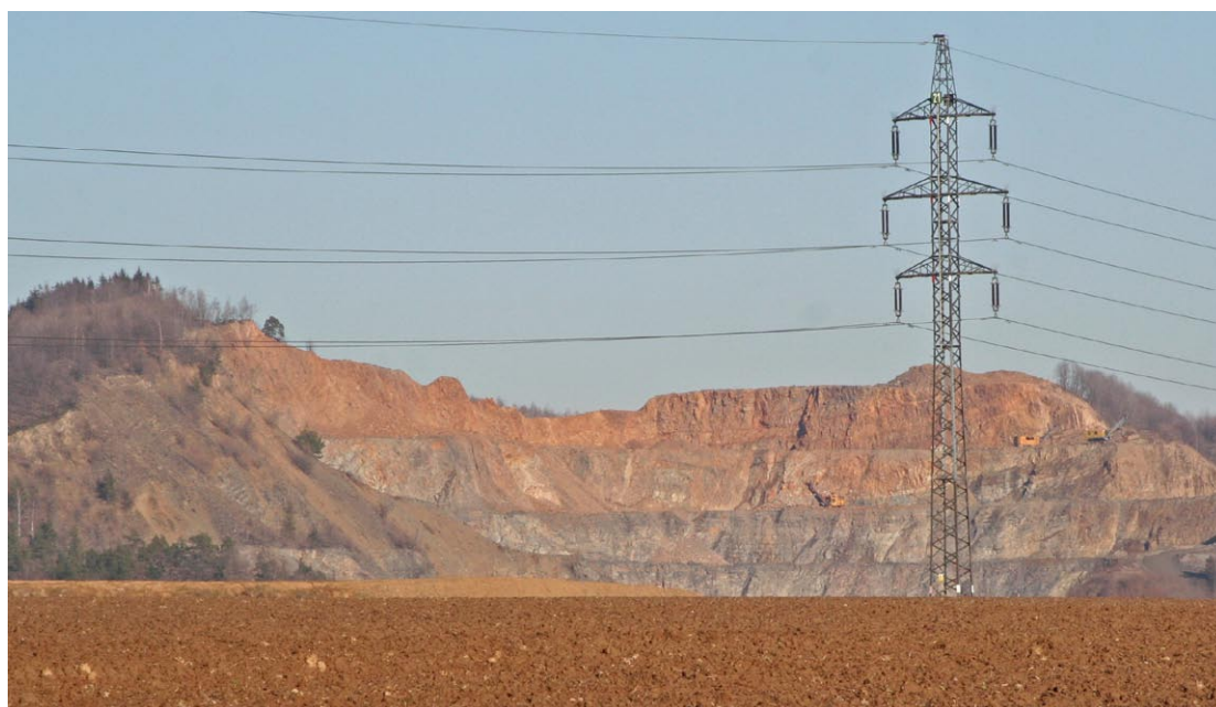
Těžba nerostných surovin výrazně ovlivňuje krajinu.