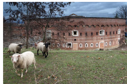
Část prostředků z 16. výzvy poputuje na obnovu fortových pevností.