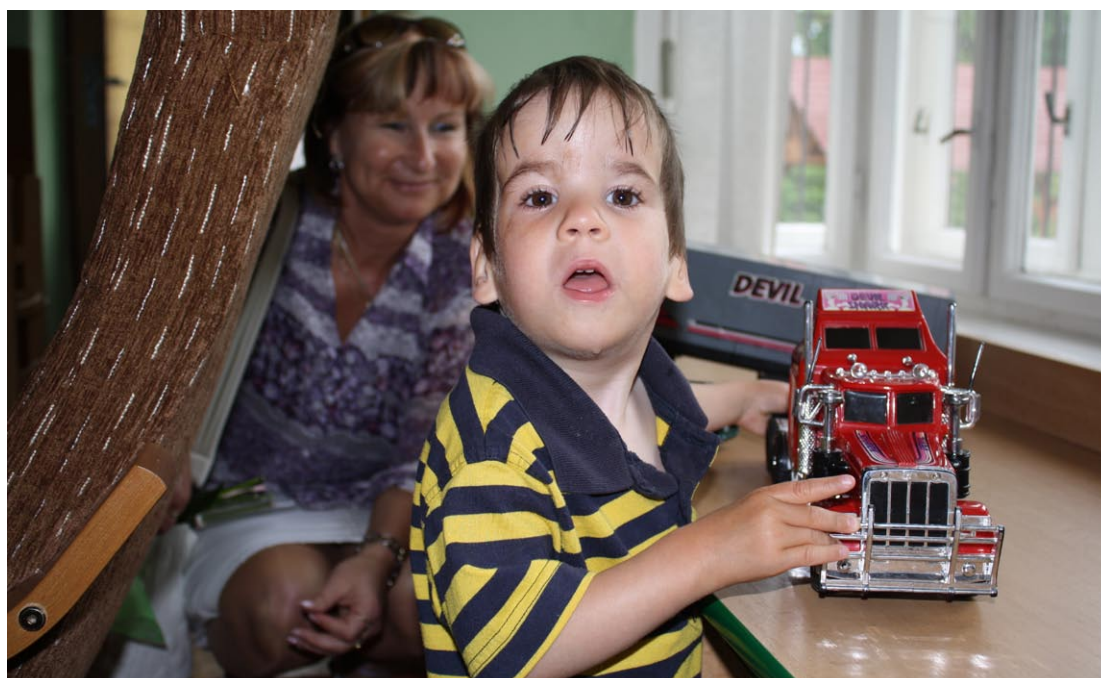
Poskytovatelé budou moci vzájemně srovnávat nabídku sociálních služeb.