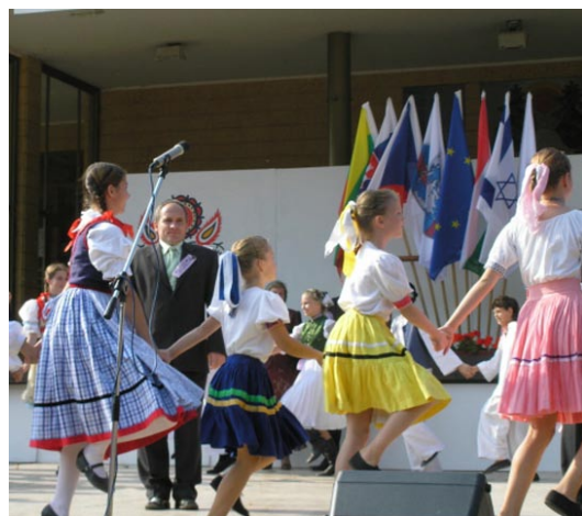
Slavnostní vyhlášení proběhlo v Luhačovicích.

Luhačovice - Obec Tučín ležící na Přerovsku zvítězila v celostátním kole soutěže Vesnice roku. Obec získala zlatou stuhu za vítězství, titul Vesnice roku 2009 a dvoumilionový příspěvek na svůj rozvoj. Cena jí byla