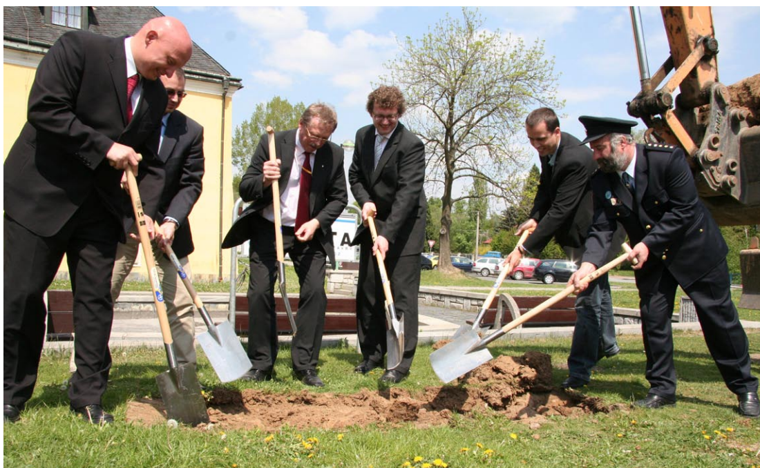
Ve Velké Bystřici letos slavnostně zahájili velkou investiční akci financovanou z ROP Střední Morava.