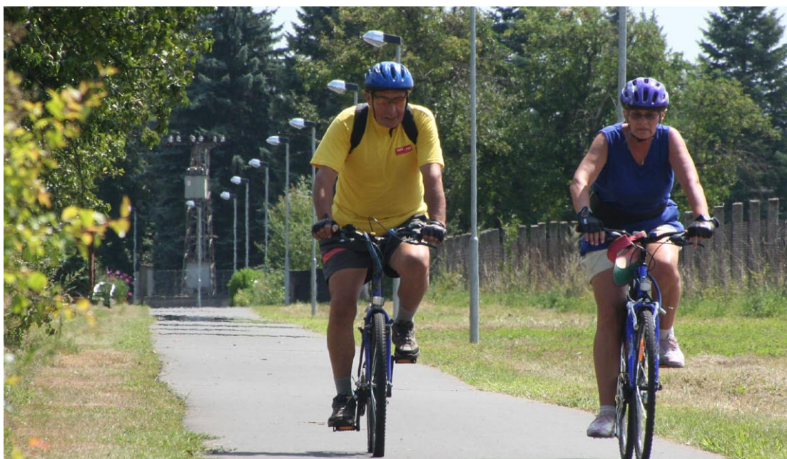
Cyklistická doprava je v Olomouckém kraji oblíbená, tras a stezek je však stále nedostatek.

Olomoucký kraj se problematikou bezmotorové dopravy zabývá již dlouhodobě a výstavba stezek a tras pro cyklisty je podporována z rozpočtu Olomouckého kraje prostřednictvím finančních příspěvků na výstavbu a opravu cyklostezek. Za účelem zmapování jejich současného stavu se v rámci projektu Podpora rozvoje Olomouckého kraje 2008 – 2010 zpracovává Územní studie rozvoje cyklistické dopravy Olomouckého kraje. Dokument, který vytváří firma Dopravní projektování, bude dokončen v říjnu letošního roku. Poslouží nejen k nastavení výzev ROP Střední Morava, ale i jako podkladový materiál pro vlastní aktivity a příspěvky Olomouckého kraje.