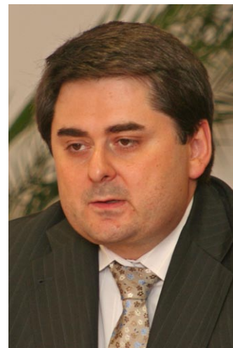
Martin Novotný primátor Statutárního města Olomouce, krajský zastupitel

Vážení občané, v Olomouci jsme před několika týdny slavnostně dokončili významný investiční projekt. Jednalo se o rekonstrukci a dobudování stokové sítě v celém městě. Tato důležitá akce si během pěti let vyžádala takřka 2 miliardy korun. Významnou část – více než 35 milionů eur (zhruba 950 milionů korun) – se nám podařilo získat z finančních prostředků EU. Uvědomujeme si skutečnost, že peníze z Evropské unie mohou výrazným způsobem přispět k rozvoji našeho města. I proto se díky pečlivé přípravě projektů snažíme získávat prostředky na různorodé aktivity. Nejinak je tomu i v případě Integrovaných plánů rozvoje města (IPRM). Využíváme také finanční prostředky z Regionálního operačního programu Střední Morava – ať už na projekty v rámci IPRM Atraktivní a konkurenceschopná Olomouc nebo IPRM Městské parky.