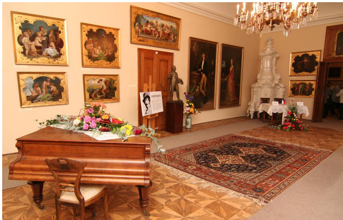
Peníze ze švýcarských fondů poslouží i na modernizaci muzejních expozic v regionu.

Bližší informace mohou zájemci získat na portálu ministerstva financí, na stránkách programu www.swiss-contribution.cz nebo na webu Olomouckého kraje. (ok)