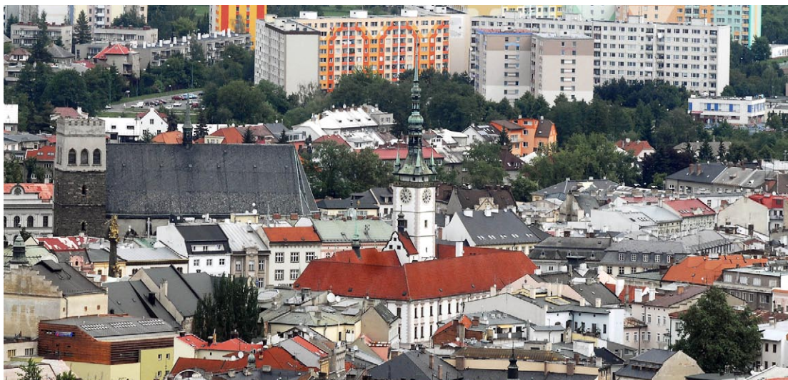
Jedna z prvních výzev nového modelu hodnocení bude zaměřena na projekty rozvoje měst Olomouce a Zlína.

Olomoucký kraj je oprávněným příjemcem podpory v prioritní ose 4 ROP – Technická pomoc v oblasti 4.2, která se týká zvyšování absorpční kapacity v regionu a zajištění úspěšného čerpání prostředků ze Strukturálních fondů EU. Využívá k tomu nejrůznějších aktivit, např. pořádá kurzy, semináře, školení a workshopy, vydává brožury, publikace a dokumenty ve vazbě na programovací období 2007 – 2013, organizuje propagační aktivity, připravuje a řídí integrované rozvojové plány a projektů a také individuální projekty, poskytuje poradenskou činnost. Olomoucký kraj je jedním z mála, který může v rámci regionů soudržnosti čerpat podporu v rámci výše uvedené prioritní osy.