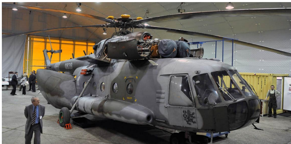
Cílem kraje je zachování smíšeného civilního a vojenského provozu.

čerpat 600 milionů korun z ROP Střední Morava, ale také z ostatních dotačních titulů. Podnikatelský plán zohledňuje regionální vlivy, popisuje také širší souvislosti v kontextu existence letišť v Ostravě a Brně. Mapuje území z hlediska dopravní infrastruktury a hodnotí reálné možnosti vybudování regionálního letiště se smíšeným provozem. (ei)