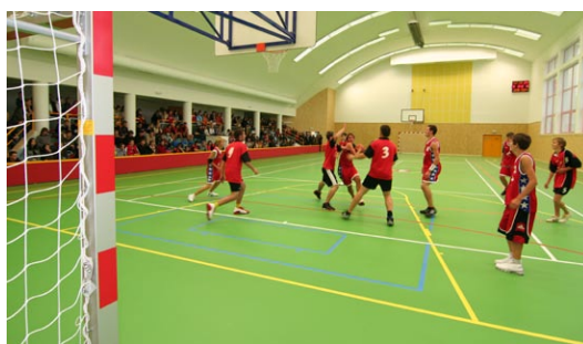
Nová sportovní hala v Mohelnici.

Olomoucký kraj - Jak veřejnost využívá sportovní kapacity u základních a středních škol? Na tuto a další otázky se snaží odpovědět analýza, zpracovaná Regionální agenturou pro rozvoj Střední Moravy v rámci projektu Podpora rozvoje Olomouckého kraje. Analýza zkoumala mimo jiné možnosti využití zařízení pro potřeby cestovního ruchu. Součástí dokumentu jsou také doporučení dalšího postupu financování rozvoje sportovních areálů z ROP Střední Morava a dalších národních i mezinárodních programů (např. Program rozvoje venkova, Finanční mechanismus EHP/Norska, apod.). Odborná veřejnost podle studie výrazně kritizuje nedostatečnou hodinovou dotaci v rámci tělesné výchovy na žáka a týden. Nezbytné úsilí o rozšíření počtu po-