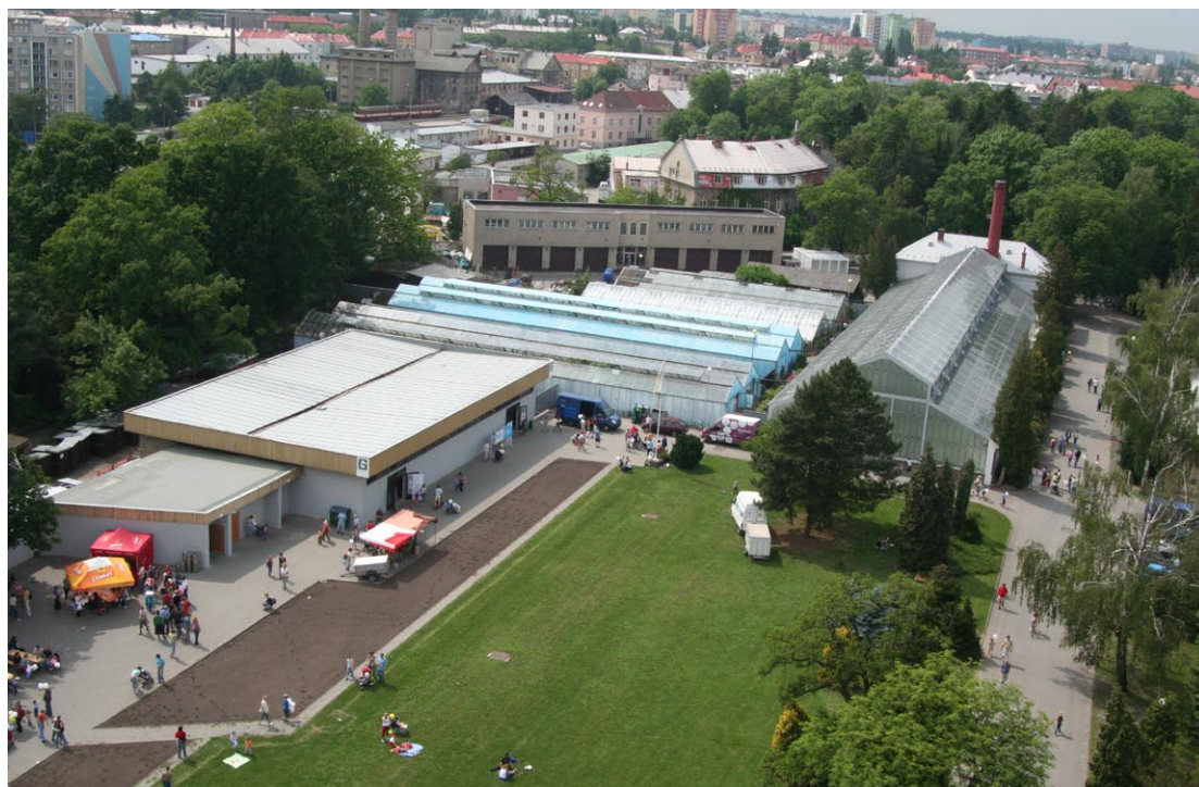
Olomouc by měla zlepšit zázemí pro výstavnictví.

Do oblasti směřovaly dotace ze státních i evropských zdrojů v posledních výzvách na rozvoj kongresové turistiky, v rámci maximalizace efektu této podpory není nutná další přímá finanční intervence velkého rozsahu, podpora stávající kongresové turistiky je na místě.