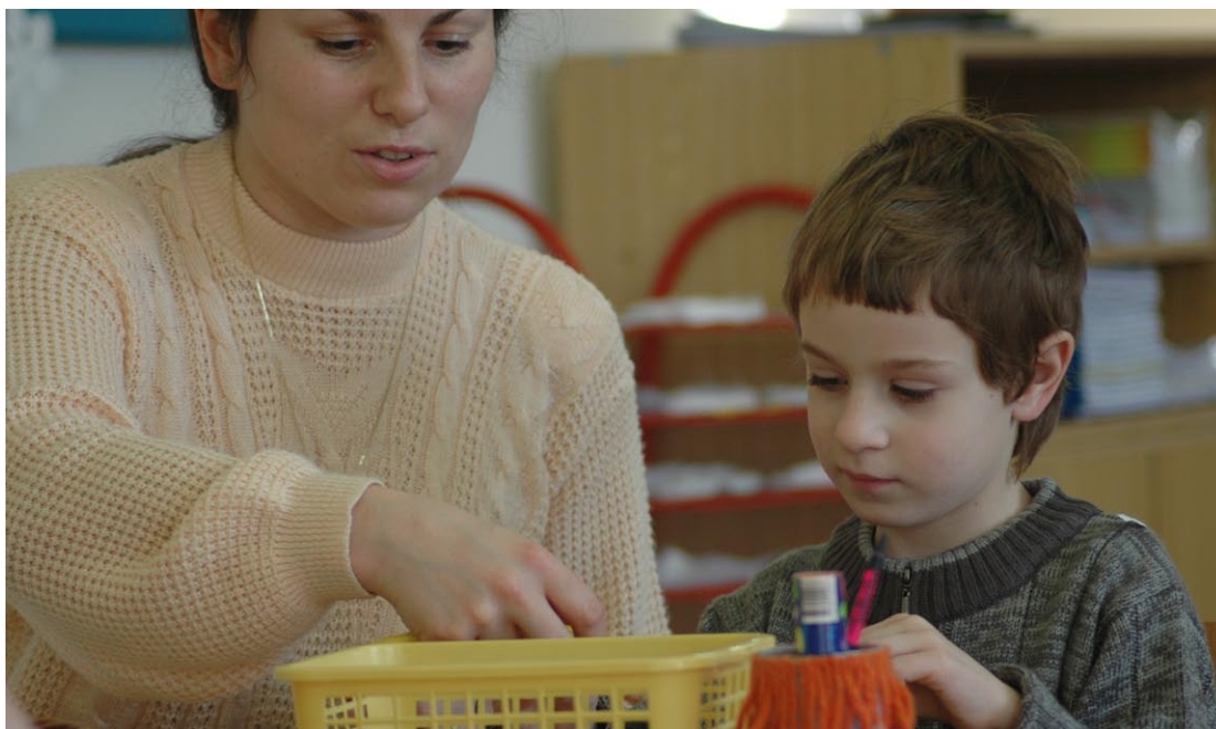
Fungování svazkových škol podporují svou činností i rodiče. Ilustrační foto.