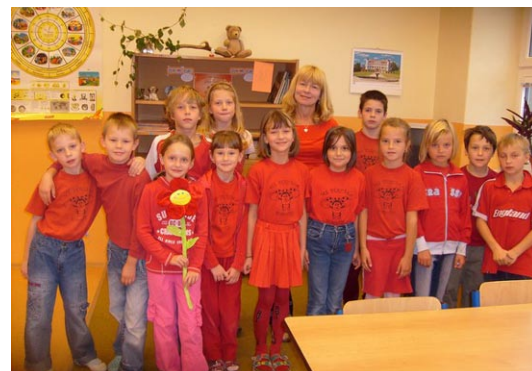
Díky svazkové škole se zastavil odliv žáků.