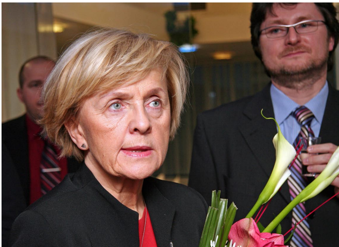
Eurokomisařka Danuta Hübnerová po příjezdu do Olomouce.

tovního ruchu. Je totiž potřeba, aby regiony soutěžily s Prahou a ukázaly, že mají co nabídnout,“ poznamenala eurokomisařka, která upozornila především na nutnost dbát na co nejvyšší kvalitu plánovaných aktivit. „Nechceme levné projekty, levné technologie a povrchní změny. Cílem je zvýšení atraktivity měst a zlepšení života občanů. V nových členských zemích často vidíme, že mnoho peněz je použito na průměrné projekty. Čím je region chudší, tím více musí opravdu dbát na kvalitu,“ zdůraznila polská zástupkyně v Evropské komisi. (ur)