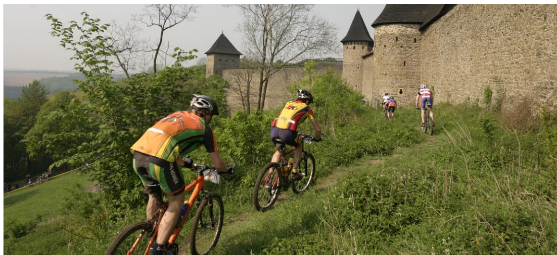
Rozvoj cyklistické infrastruktury napomůže i ke zvýšení návštěvnosti památek.

Studie mimo jiné prověří reálné možnosti lokalizace rozvojových ploch vhodných k podnikání, s ohledem na ochranu životního prostředí, zatížení území limity či na potřebnou dopravní a energetickou dostupnost.