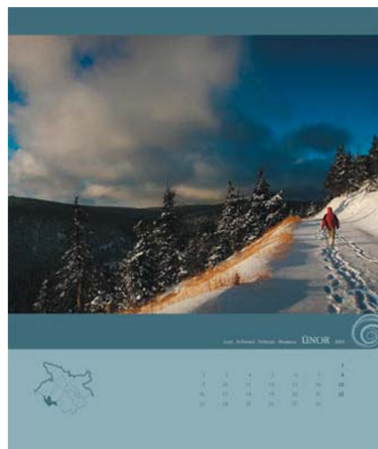
Kalendář Jeseníky 2009

Jesenická rozvojová, o.p.s. - www.jesenicko.eu ; Město Rýmařov - www.rymarov.cz ; Město Jeseník - www.mu-jes.cz ; Město Vrbno pod Pradědem - www.vrbnopp.cz ; Město Bruntál - www.bruntal.cz ; Město Krnov - www.krnov.cz ; Obec Horní Město; Obec Loučná nad Desnou - www.loučna-nad-desnou.cz ; MAS Nizký Jeseník; MAS Rýmařovsko, o.p.s. - www.rymarovsko.cz ; Artory, s.r.o.; Artory - Consulting, s.r.o., - www.artory.cz . (sj)