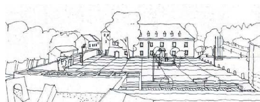
Studie centra Velké Bystřice.

Národopisné přehlídky a jiné kulturní akce mají být napříště přemístěny do přilehlého zámeckého parku, kde bude umístěn amfiteátr. Velikost amfiteátru i jeho situování bylo v návrhu pečlivě zváženo. Návrh vychází ze zásady zachování stávajících přírodních podmínek parku, zcela minimálního úbytku vzrostlé zeleně a to v souladu s vyhodnocením zeleně. V západním křídle zámku by mělo být po plánovaných stavebních úpravách umístěno turistické informační centrum, hanácké národopisné a folklorní muzeum, výstavní prostory a zázemí k amfiteátru. Do podkroví budou vestavěny šatny a hygienické zařízení pro vystupující.