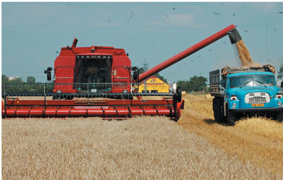
Dotace podpoří rozvoj tradičních venkovských oblastí na Moravě.

Některé z desítek projektů si představíme podrobněji. Jak se s náročnou administrací projektu vypořádali v Lošticích, které na dva projekty získaly přes 40 milionů korun? Jak se vyplatila pečlivá příprava obcí Střítež nad Ludinou a městu Velká Bystřice? Podrobnosti najdete na dalších stranách. (ei)