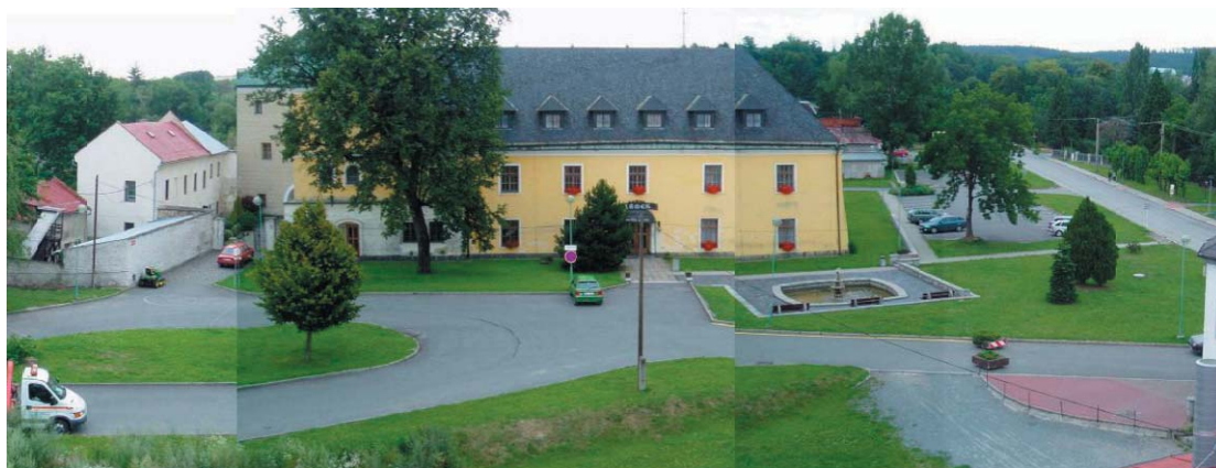
Okolí zámku ve Velké Bystřici se díky rekonstrukci změní k nepoznání.

- v městečku, které je centrem mikroregionu Bystřička, žijí tři tisíce obyvatel. Vyhlášené je především bohatým kulturním, společenským a sportovním životem. Každoročně se v obci koná mezinárodní folklorní festival Lidový rok, folklorní akce jako Masopust, Svatostěpánské koledování, Zpívání u vánočního stromu, festivaly trampské písně Bystřické banjo, Regi banjo, festival ochotnických souborů, cykloturistická akce Bílý kámen a řada dalších. Většina z aktivit je soustředěna právě do centra městečka, na Zámecké náměstí a jeho přilehlé okolí.