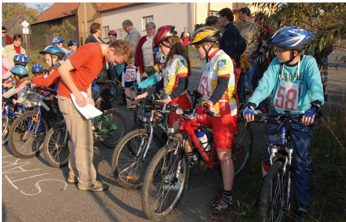
Cyklistiku na Hranicku propaguje během roku i řada doprovodných akcí.

Kromě této tematické cyklotrasy samozřejmě nabízí Hranicko hustou síť značených cyklotras a turistických materiálů. Regionem prochází Greenways Jantarová stezka, intenzivně se pracuje na dokončení cyklostezky Bečva, propojující Hranice přes Lipník nad Bečvou, až po Přerov, jižní část Hranicka zvaná Záhoří nabízí tematickou cyklotrasu, jejíž spojnicí je kromě krásné krajiny též velké množství božích muk či křížků a památných stromů. Město Hranice nedávno vydalo mapu příměstských cyklistických okruhů, v nichž některé úseky vedou dokonce i mimo značené cyklotrasy a uspokojí tak i ty intenzivní výletníky, kteří už třeba stačili všechny značené úseky na Hranicku projet. (hr)