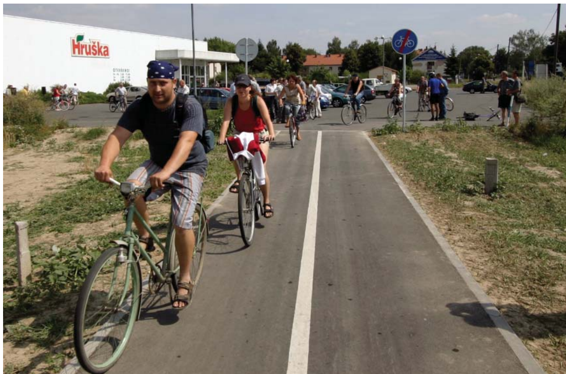
Cyklostezka spojuje Uničov na Olomoucku i s nedalekými Střelicemi.

Uničovem a Novou Dědinou vyrostě 1 600 metrů dlouhá cyklostezka. Obě komunikace budou součástí regionální cyklotrasy číslo 511 z Jeseníku do Znojma. Celkové náklady na zbudování spojnic přesahují 10,25 milionu korun. Z nich však skoro 8,8 milionu pokryje dotace z Regionálního operačního programu Střední Morava.