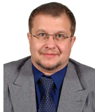
Mgr. Petr Polášek radní Olomouckého kraje

Bezmála dvě stě účastníků 1. října 2008 v Olomouci zavítalo na konferenci pod názvem Regionální operační program Střední Morava a Olomoucký kraj (zkušenosti z prvních výzev). Přítomní ocenili přínos akce, nejvíce je zaujaly prezentace náměstka hejtmána Pavla Horáka, náměstka ministra pro místní rozvoj Milana Půčka a vystoupení Ivana Matulíka.