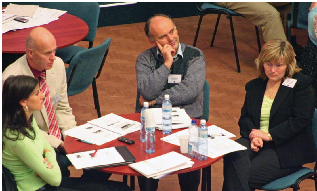
Konference o zkušenostech z prvních výzev ROPu byla pro účastníky přínosem.

Z dotazníkového šetření, které bylo na místě provedeno, vyplývá, že dvě třetiny respondentů už mají připraveny další projektové náměty. Pro další nastavení aktivit projektu Podpora rozvoje Olomouckého kraje, v jehož rámci konference proběhla, je podstatný zájem účastníků o vzdělávací aktivity, zejména z oblasti finančního řízení projektů, způsobilých výdajů, účetnictví a veřejných zakázek. (lv)