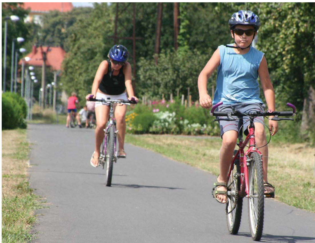
Příspěvek z krajského programu putoval i na budování cyklostezek z Věřovan do Dubu nad Moravou.

Rok 2004*5.564.000,- Kč Rok 2005*14.433.000,- Kč Rok 2006*14.774.000,- Kč Rok 2007*12.000.000,- Kč CELKEM*46.771.000,- Kč