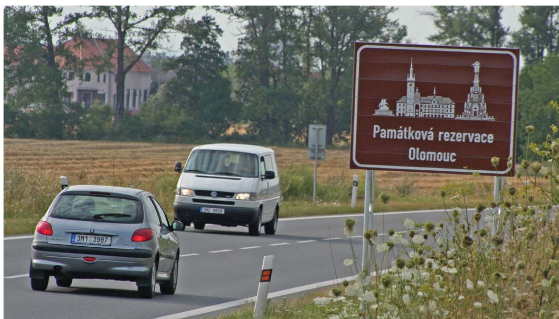
Informační tabule lákají motoristy k návštěvě nejzajímavějších míst v regionu.