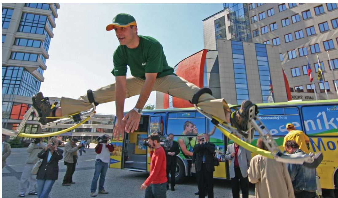
Představení turistického infobusu před sídlem kraje v Olomouci.