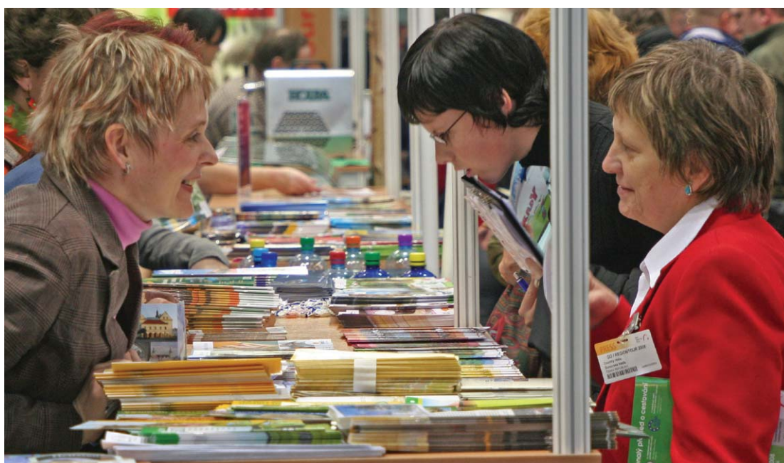
Stánek Olomouckého kraje připravený ve spolupráci s obcemi na veletrhu cestovního ruchu Regiontour.