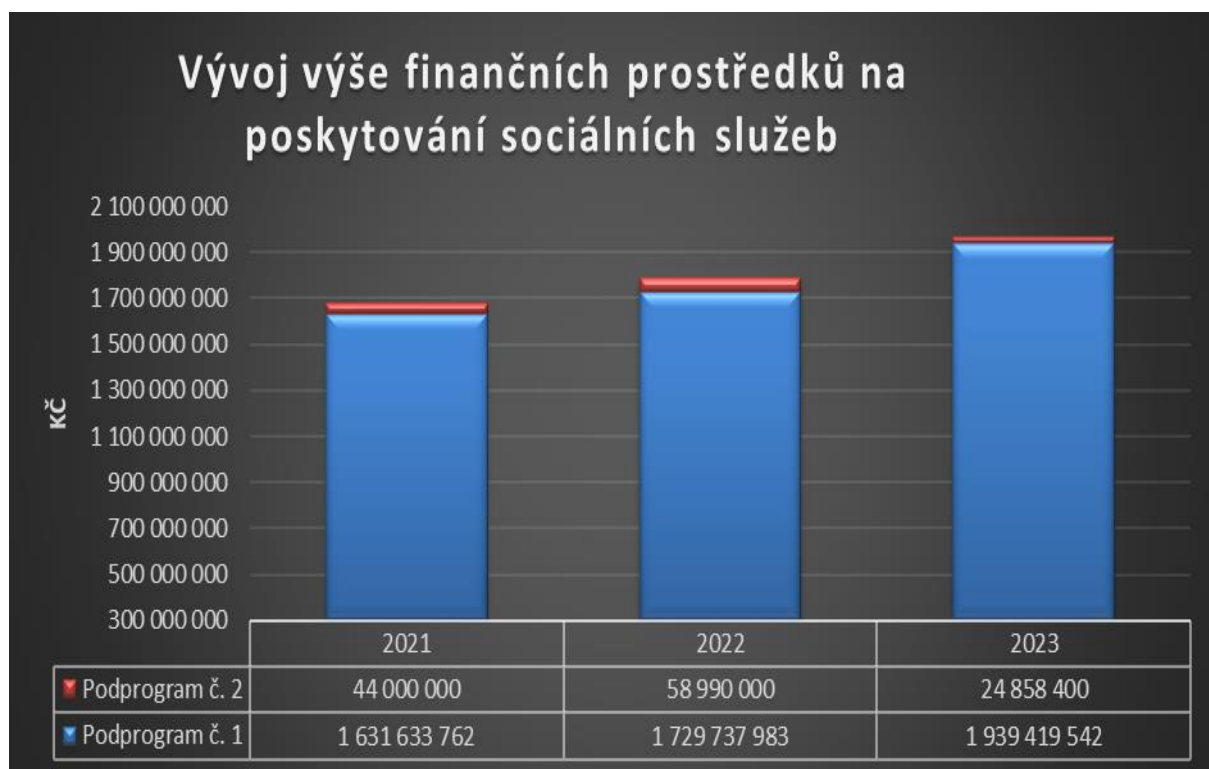
Graf č. 1 – Vývoj výše finančních prostředků na poskytování sociálních služeb poskytnutých formou dotací z Podprogramu č. 1 a 2

V této kapitole kapitolách jsou uvedena data týkající se finanční podpory sociálních služeb ve formě tabulek a grafů, které shrnují financování sociálních služeb dle jednotlivých programů v letech 2021-2023 a rovněž se zaměřují na meziroční souhrny a porovnání vybraných ukazatelů.