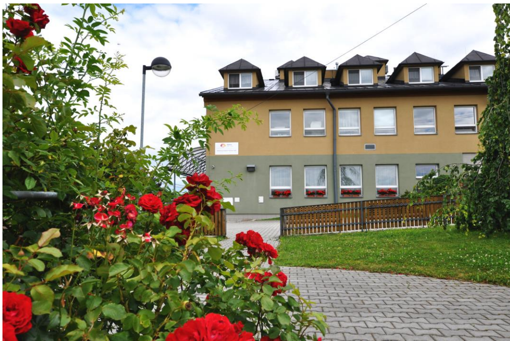
Domova Štítý – Jedlí, p.o.