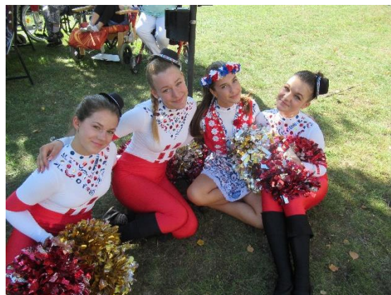
Odpoledne s pohybem