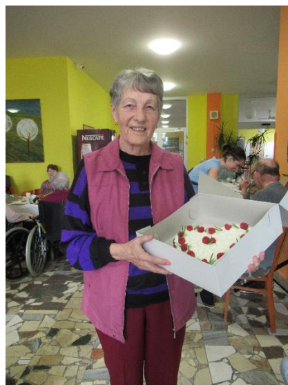
Výherkyně hlavní ceny v tombole na Josefovské zábavě