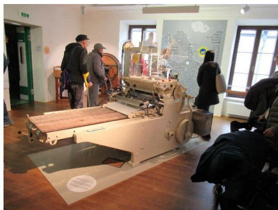
Výlet do Mohelnice a Loštice