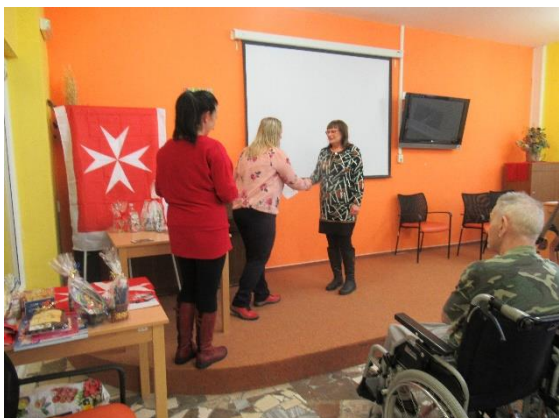
Koncert pro dobrovolníky