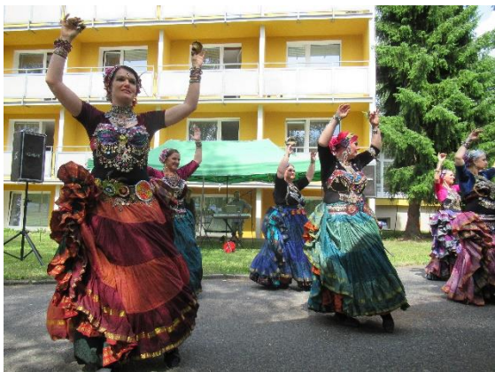
Zahradní slavnost - vystoupení Angel's tribe