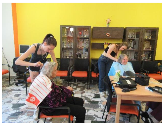
Beauty day - kadeřnice SOU Řemesel