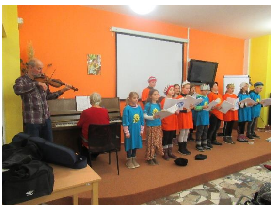
Mikulášské vystoupení ZŠ Sluneční