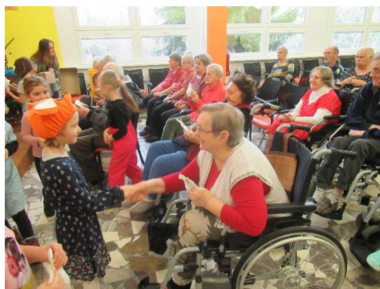
Vánoční koledy MŠ Pohádka