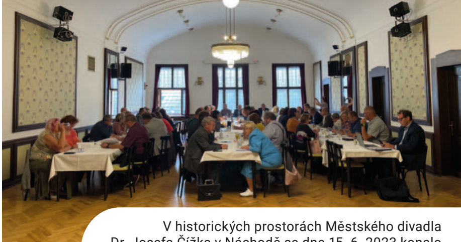
V historických prostorách Městského divadla Dr. Josefa Čížka v Náchodě se dne 15. 6. 2023 konalo setkání členské základny sdružení – Regionální kongres Euroregionu Glacensis.