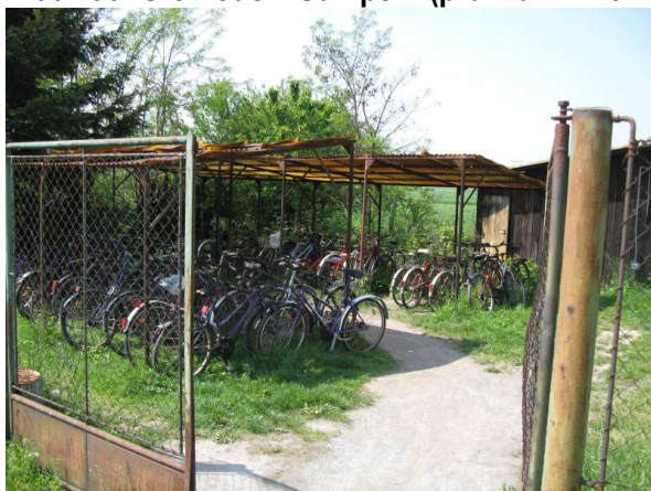
Újezd u Uničova (1) – 42 kol (kapacita 50 míst)