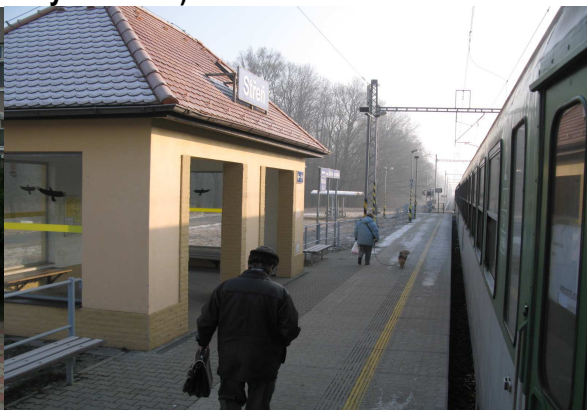
Střeň – nový stojan v rámci rekonstrukce