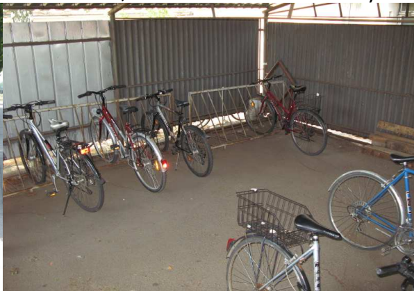
Uničov – úschova (pohled č.1) – 8 kol (kap. 30 míst)