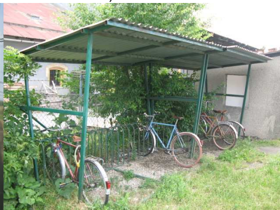
Trat' 301 - Nezamyslice – důležitý železniční uzel - bez infrastruktury (kola opřená o plot)