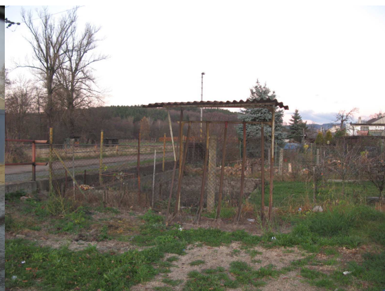
Postřelmov – bez infrastruktury