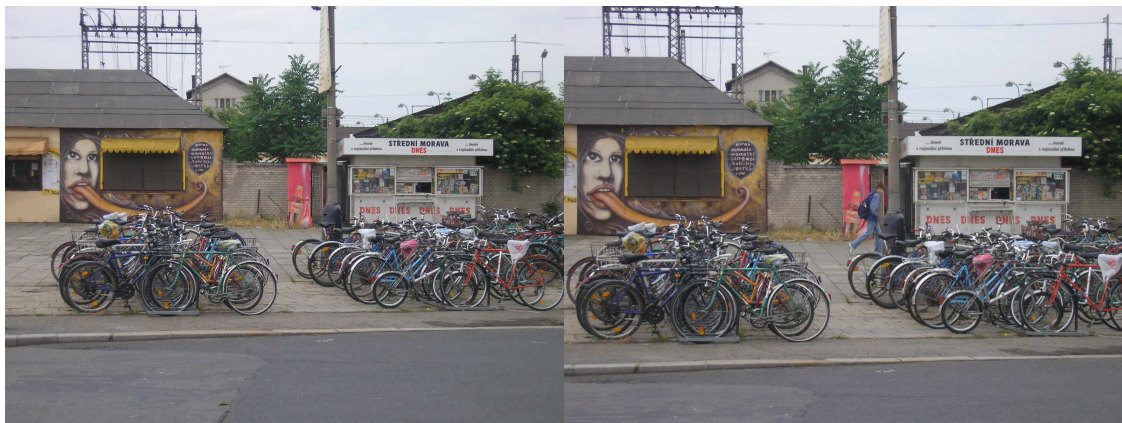
Přerov – viz. samostatný dopis