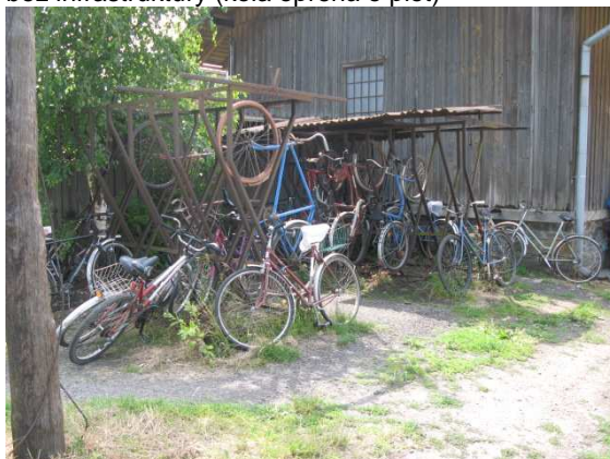
Trat' 320 + autobusová zastávka – Příkazy (stojan pro cca 20 kol)