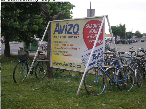
Přerov – viz. samostatný dopis