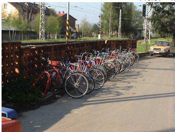
Hranice 18 kol (kapacita 20)