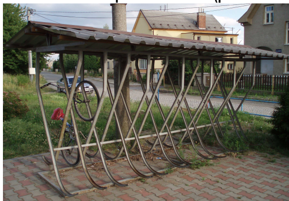
Štěpánov – foceno o víkendu