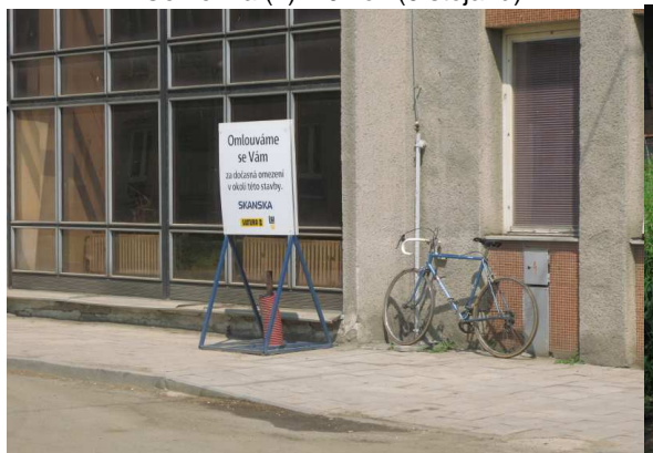
Červenka (3) – 1 kolo (0 stojanů)