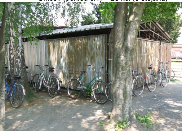
Uničov (pohled č.3) – 23 kol (0 stojanů)