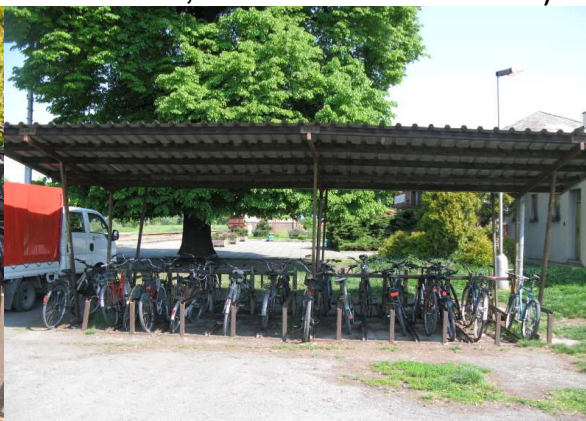
Bohuňovice – 25 kol (kapacita 40 míst)