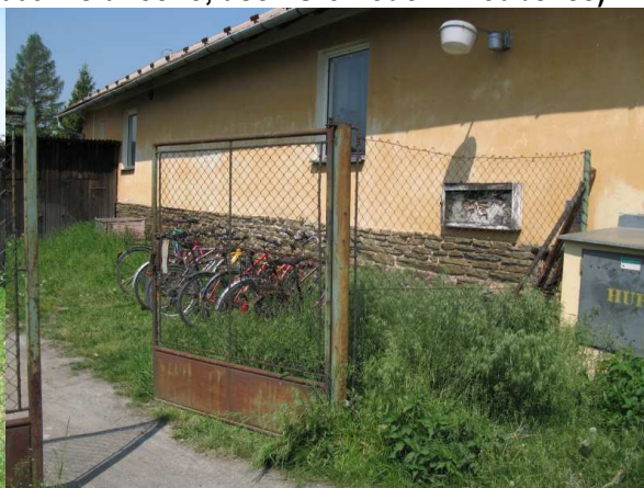
Újezd u Uničova (2) – 9 kol (kapacita 8 míst)