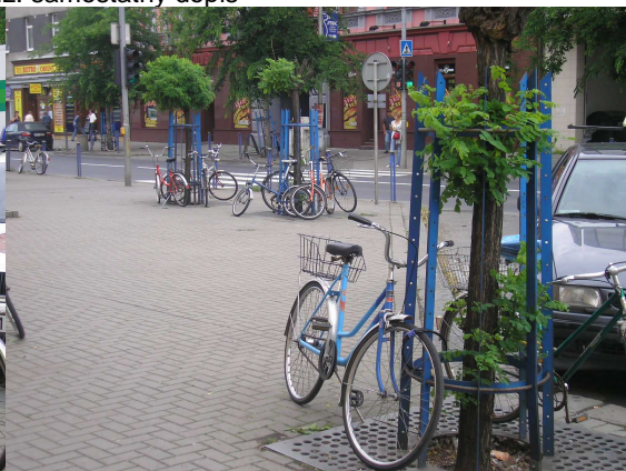
Přerov – viz. samostatný dopis