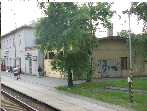
Lipník nad Bečvou – nebyly zjištěny žádné údaje