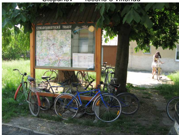
Červenka (1) – 9 kol (0 stojanů)