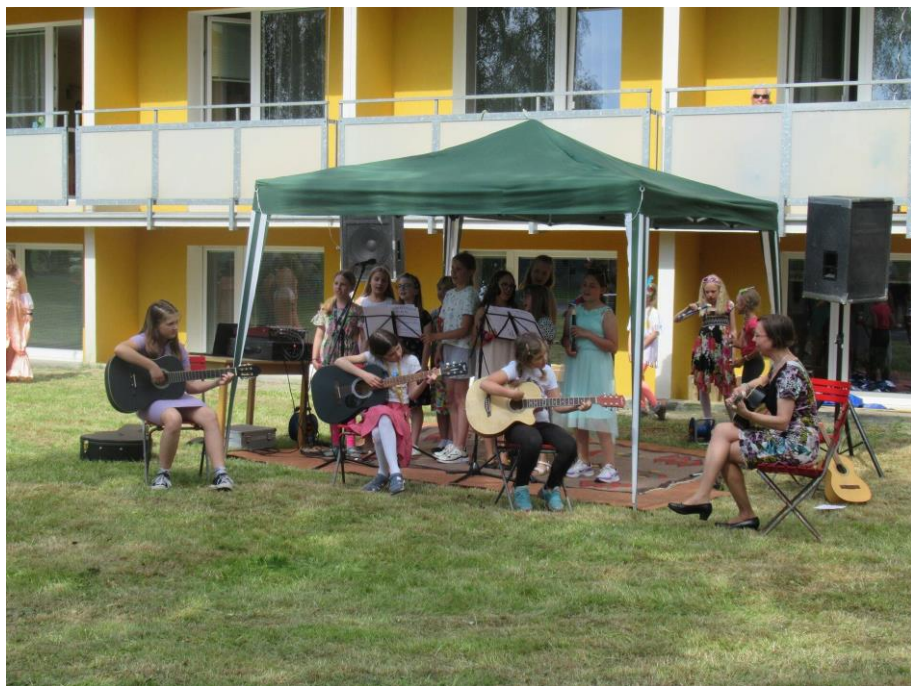
Festival rodiny - vystoupení žáků 5. ZŠ