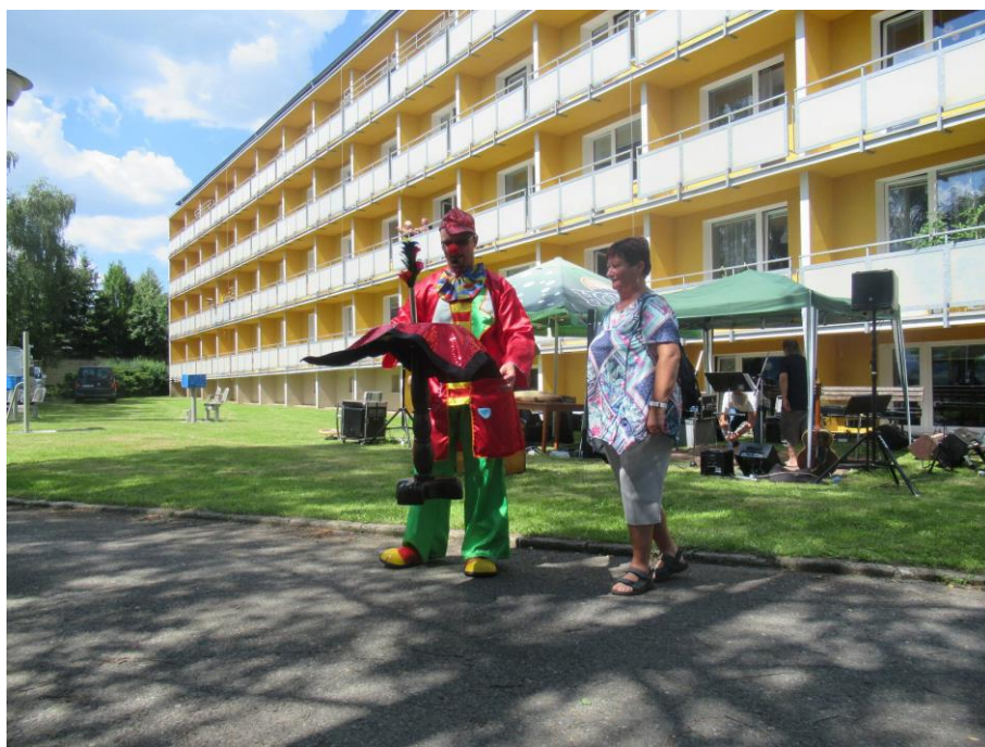
Zahradní slavnost - přišel k nám i kouzelník