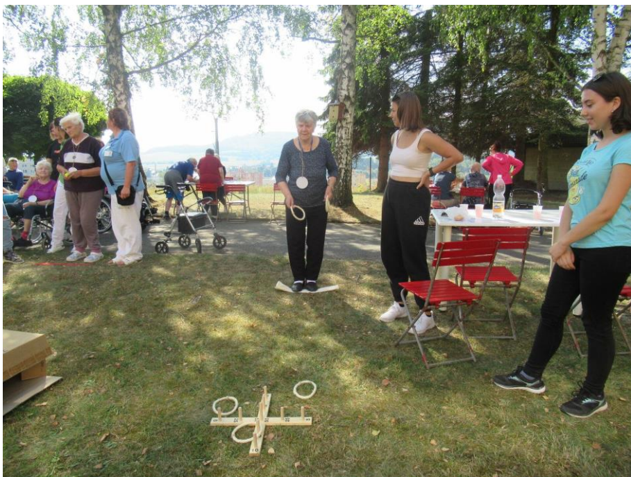
Odpoledne s pohybem