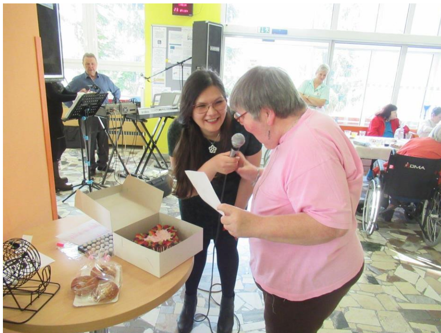
Josefovská zábava - výherkyně hlavní ceny tomboly