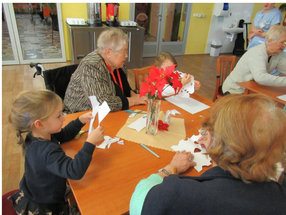
Vánoční dílna s MŠ Borůvka