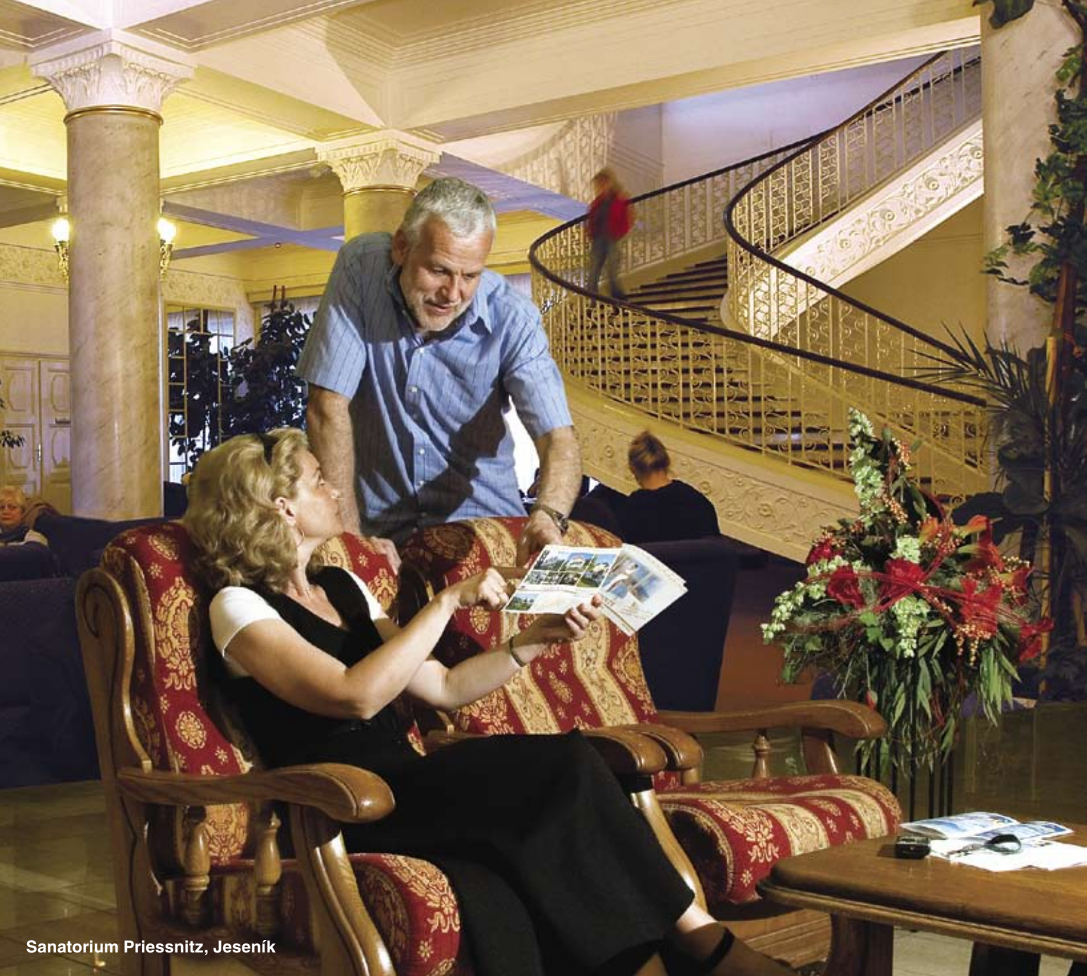
Sanatorium Priessnitz, Jeseník