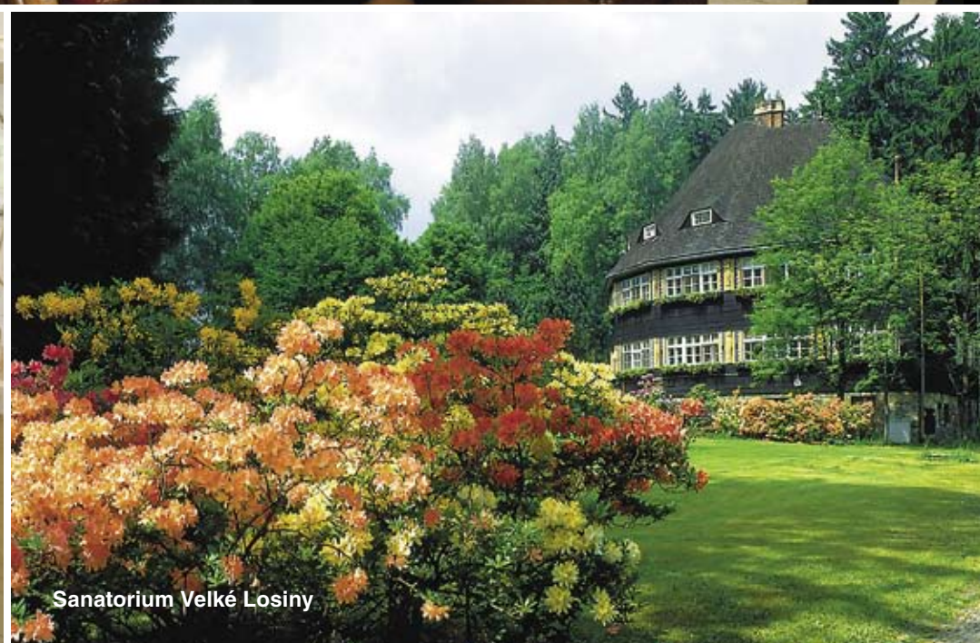
Sanatorium Velké Losiny