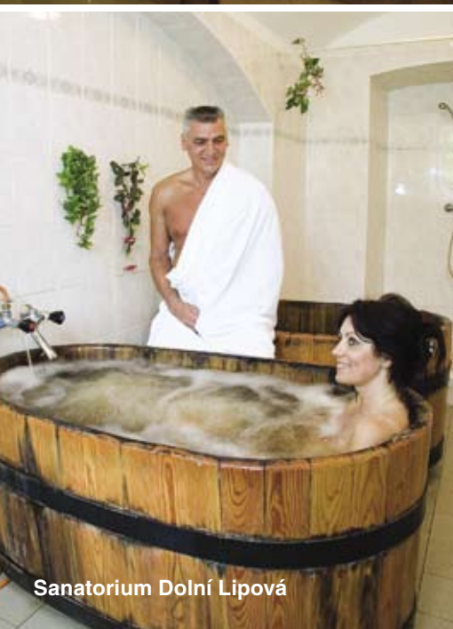
Sanatorium Dolní Lipová